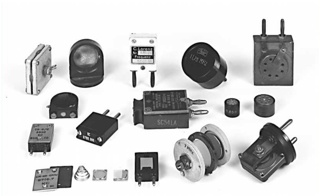
Abb. 1.4 Quarze im Luftspalhalter, in Kunststoff- oder Keramikgehäusen

immer noch auf durchstimmbare Funkgeräte gesetzt, was sehr robust aufgebaute Geräte voraussetzte. Dafür gab es keinen "Quarzengpaß". Nur die ZF-Oszillatoren und Quarzfilter enthielten präzise Quarze.