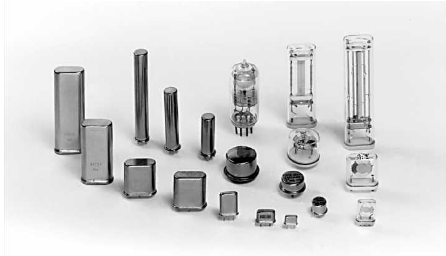
Abb. 1.5 Glas und Metallgehäuse