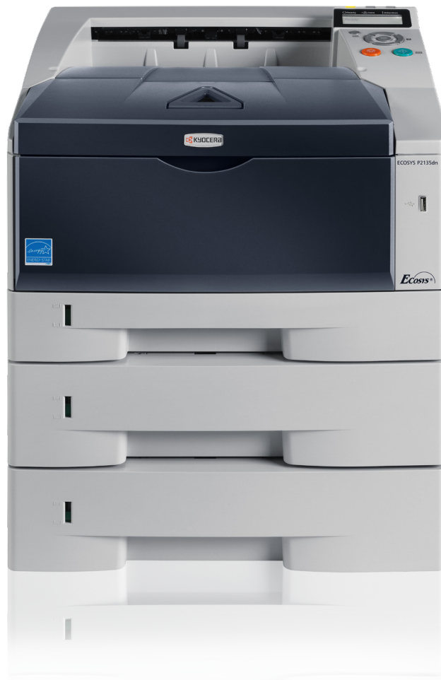
Abb. mit Optionen